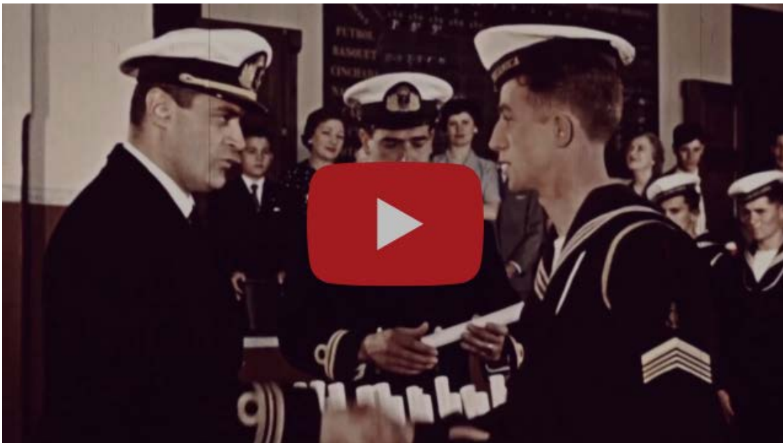
"De Escuela a Centro Clandestino"

En esta oportunidad les presentamos "De Escuela a Centro Clandestino", el video que forma parte de la sala donde funcionaba el comedor del ex casino de oficiales, en el que se relata cómo la Escuela de Mecánica de la Armada pasó a convertirse en un centro de detención, tortura y exterminio.