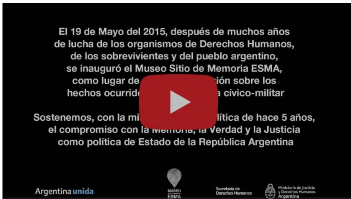
Museo Sitio de Memoria ESMA 5 años

El 19 de mayo de 2015 se inauguró el Museo Sitio de Memoria ESMA, como resultado de la lucha de los organismos de DDHH, del reclamo popular, y de la voluntad política de un gobierno que estableció los procesos de Memoria, Verdad y Justicia como el camino de la consolidación de la democracia argentina. Esta vez nos tocó cumplir el aniversario desde nuestras casas, en medio de una situación que nos atraviesa como sociedad, pero seguimos fieles al compromiso de seguir construyendo memoria.